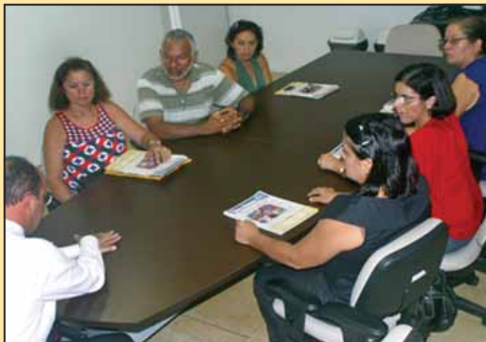
Audiência com a Secretária Estadual de Administração

Exemplo disso foram o “plantões pós-greve”. Antes, as negociações pós-greve se seguiam a momentos de trégua, nos quais o Sindicato esperava o cumprimento das promessas. O problema é que, logo ao se livrar do incômodo, o Governo