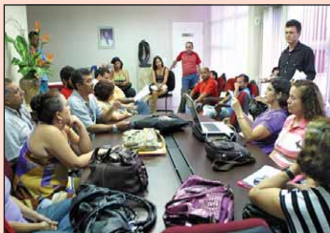
Ocupação do Gabinete do secretário estadual de educação

A direção do Sindicato vai continuar agindo estrategicamente. Mobilizando toda a categoria para fazer movimentos, a exemplo das paradas e greves ou agindo de forma mais direta e rápida.